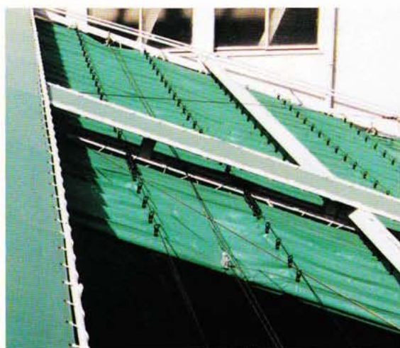
開閉はスムーズ、スピーディ!