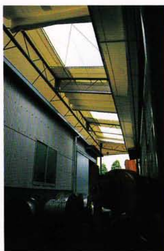
小さなスペースも作業空間に早変わり!