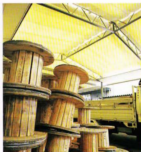
商品の一時保管に!