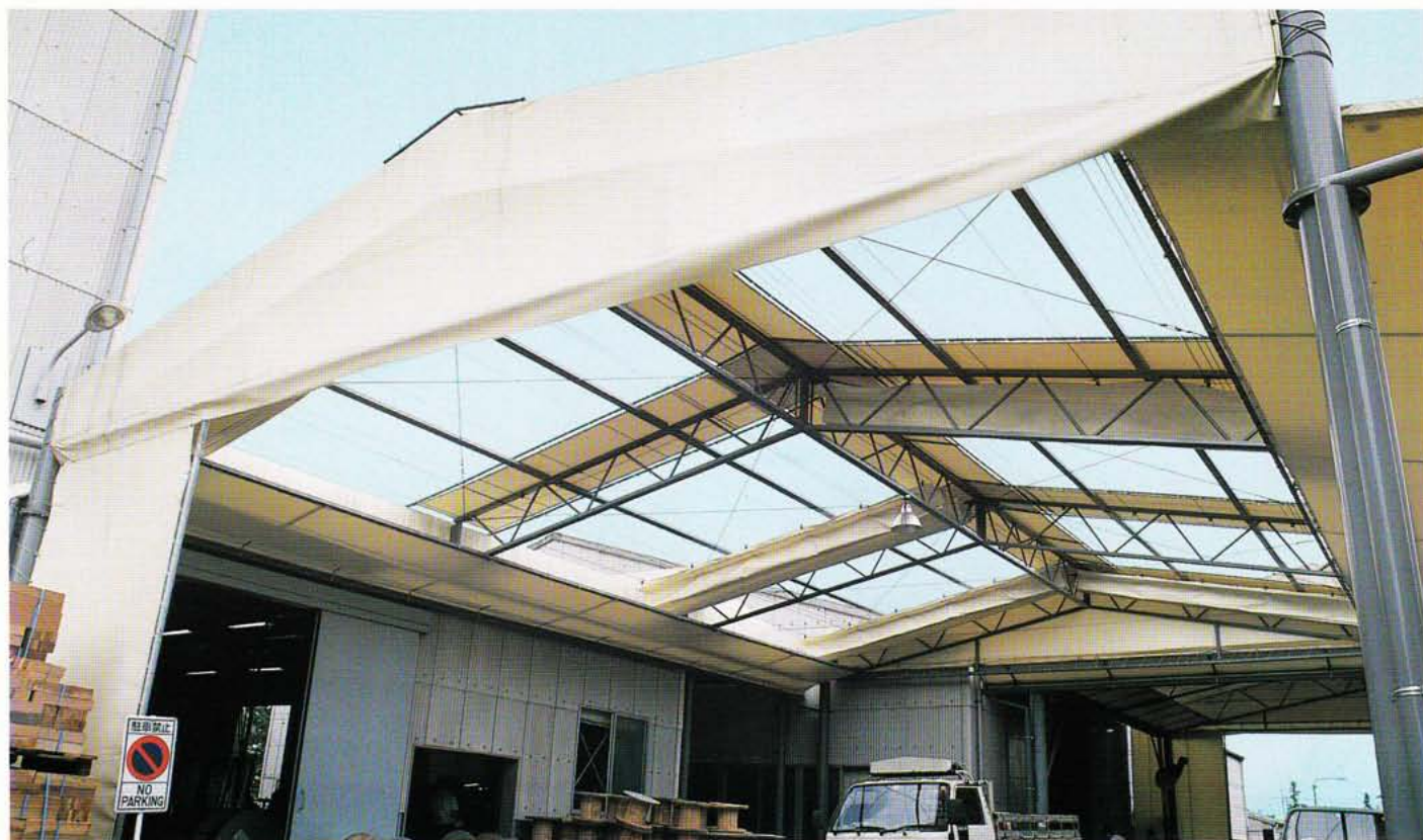
工場通路上に設置し、荷捌場として活用!